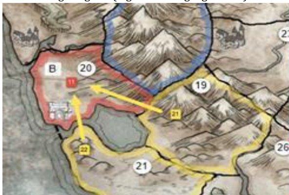
Lovligt Angreb. (2 gule hære og 2 grænser)