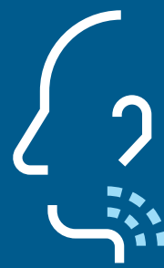
Ondt i halsen

Bliv også hjemme, hvis du er i tvivl, om du er syg. Isolér dig og sørg for at blive testet. Bliv hjemme indtil 48 timer efter, at dine symptomer er helt forsvundet.